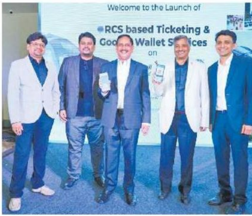
డిజిటల్ టికెట్స్ను ప్రారంభిస్తున్న ఎన్వీఎస్ రెడ్డి, ప్రతినిధులు

లతో ఒప్పందం కుదుర్చుకుంది. టీఎన్ఆర్టీసీ, ర్యాపిడ్, స్విడా, మెట్రోరైడ్, హాలా మొబిలిటీ, రైడ్ ఈజీ, యారి, మన యాత్రీతో కలిసి మెట్రో ప్రయాణికులకు సేవలందిస్తున్నట్లు ప్రకటించింది. లాస్ట్ మైల్ కనెక్టివిటీ కింద స్విడా సంస్థ ఇప్పటి వరకు 50 లక్షల మందిని చేరవేసినట్లు వెల్లడించింది. పస్ట్ మైల్, లాస్ట్ మైల్ కనెక్టివిటీని ఏకీకృతం చేయడం ద్వారా మెట్రో ప్రయాణికులకు మెరుగైన సేవలందిస్తున్నట్లు ఎల్ఆండీటీ ఎండ్ కేవీబీరెడ్డి తెలిపారు. రోజువారీ ప్రయాణికుల్లో 1.10 లక్షల మంది పస్ట్ మైల్, లాస్ట్ మైల్ కనెక్టివిటీ వినియోగించుకుంటున్నట్లు ఎల్ఆండీటీ చీఫ్ ప్రాటజీ ఆఫీసర్ మురళీ వరదరాజన్ పేర్కొన్నారు.