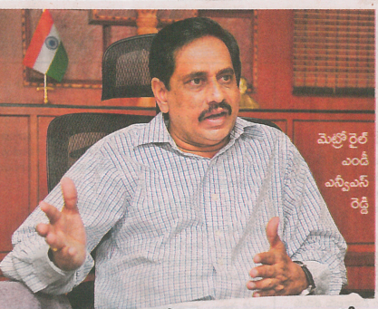
మెట్రో రైల్ ఎండ్ ఎన్టీఎస్ రెడ్డి