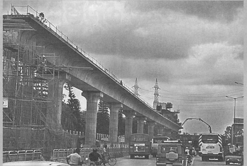
భాగ్యనగరానికి సరికొత్త అందాలు : తీరనున్న ట్రాఫిక్ సమస్యలు