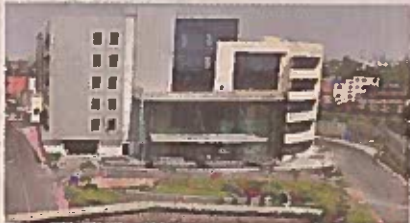
మెట్రో కేంద్ర కమాండ్ కంట్రోల్ సెంటర్

మాడు కోచ్ లో ప్రతి రైలు నడుస్తుంది. ఈ రైలుకు వెనుక, ముందు ఇంజనీరుంటాయి. అన్నిమా