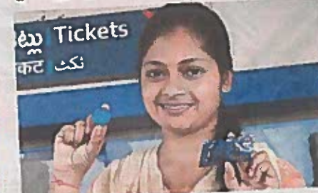
టోకెన్, స్మార్ట్ కార్డుతో మెట్రో సిబ్బంది