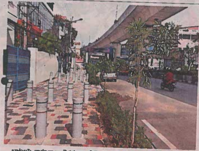
బాటలపై వాహనాలు వెళ్లకుండా సిమెంటు దిమ్మల ఏర్పాటు, పక్కనే మొక్కలు

జూబ్లీహిల్స్, న్యూనటుదే: మెట్రో రాకతో జూబ్లీహిల్స్ రూపురేఖలు మారుతున్నాయి. ప్రధానంగా ఆ మార్గంలో రహదారుల పక్కన అందాలు రెట్టింపవుతున్నాయి. పచ్చని అందాలతోపాటు నగరాన్ని మరో స్థాయికి తీసుకెళ్లే అందాలు సమకూరుతున్నాయి. వర్షపు నీరు వెళ్లే దారులు మొదలుకొని.. పాదచారుల బాట వరకు ప్రత్యేక అందాలు సంతరించుకొంటున్నాయి. పచ్చదనానికి ఎరువు తివాచీ వేస్తున్నారు. కంటికింపుగా రంగుల చిత్రకళలు.. వర్షపు నీటిని ఒడిసిపట్టేందుకు ఇంకుడుగుంథలు.. ఇలా అన్నీ మెట్రో రాకతో సమకూరుతున్నాయి.